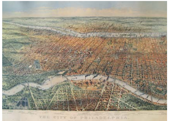
Rechts: Philadelphia, Chromolitho, datiert 1875, Graphica Antiqua (CHF 8000.-).