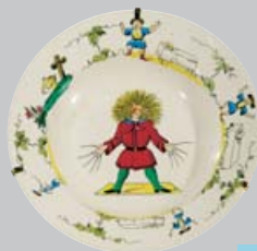
Der Struwelpeter im Kindermuseum Baden

Hacker'sche Holzspielwaren hatten Weltgeltung