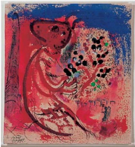
Marc Chagall, Femme au double profil , 1964, Tusche/Pastell, Galerie Française.

Für viele Freunde, Kenner und Sammler hochwertiger Antiquitäten und Kunst ist die Zürcher Fine Art ein «must», deren Daten zum Besuch dick im Jahreskalender eingetragen werden. Fünf Tage lang präsentieren bedeutende Galeristen und Antiquitätenhändler aus der Schweiz und dem Ausland Kostbarkeiten verschiedenster Art dem Publikum. Die verschiedenen Messestände sind wie üppig bestückte Schaufenster, nur dass hier das Publikum nicht an den Scheiben «kleben» muss, sondern dass es sich inmitten der Exponate mit den Objekten beschäftigen kann. Und – liebe Leserin, lieber Leser – nehmt diese Gelegenheit wahr! In keinem noch so besucherfreundlichen Museum kann man das Auge besser schulen als an einer Messe wie der Fine Art!