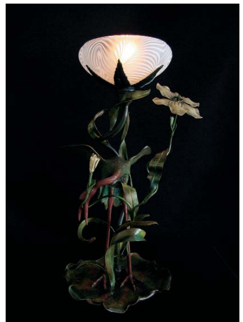
Tischlampe mit Kranich und Sumpflumen, Jugendstil, Dieter Keller (CHF 4900.–).