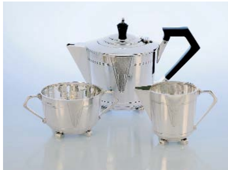
Silbernes Tee-Set, Sheffield, Art déco, 1935, E. & C. Vouga (CHF 2800.–).