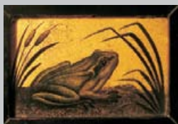
Hinterglasmalerei in Romont