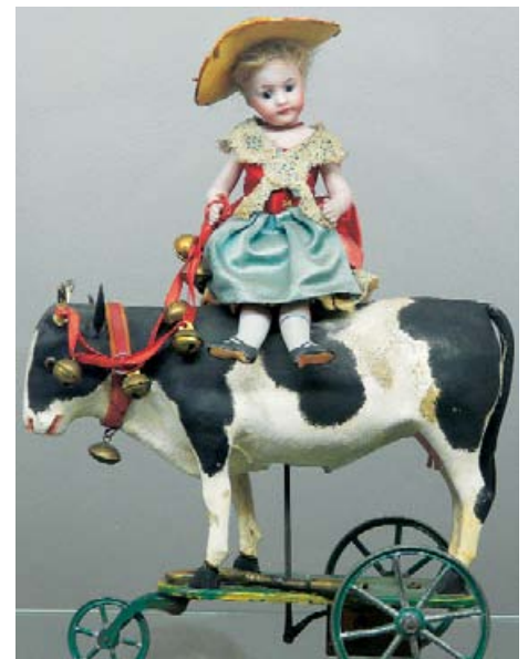
Kuhreiterin, Ziehspielzeug mit Uhrwerk, Paris um 1880.