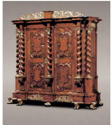
Basler Barockschränk, 1670/80, Anja Ritter.