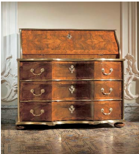
Schreibkommode, Werkstatt Matthäus Funk, um 1745, Rudolf Bosch.

Für viele Freunde, Kenner und Sammler hochwertiger Antiquitäten und Kunst ist die Zürcher Fine Art ein «must», deren Daten zum Besuch dick im Jahreskalender eingetragen werden. Fünf Tage lang präsentieren bedeutende Galeristen und Antiquitätenhändler aus der Schweiz und dem Ausland Kostbarkeiten verschiedenster Art dem Publikum. Die verschiedenen Messestände sind wie üppig bestückte Schaufenster, nur dass hier das Publikum nicht an den Scheiben «kleben» muss, sondern dass es sich inmitten der Exponate mit den Objekten beschäftigen kann. Und – liebe Leserin, lieber Leser – nehmt diese Gelegenheit wahr! In keinem noch so besucherfreundlichen Museum kann man das Auge besser schulen als an einer Messe wie der Fine Art!