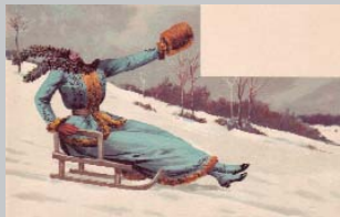
25 Jahre AK-Börse