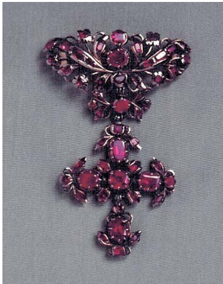
Links: Corsage-Brosche, Silber/Rubine, Augsburg, 18. Jh., Howald's Erben.