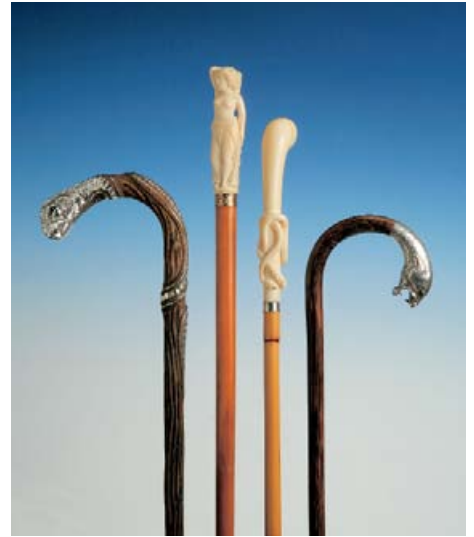
Drachenkopf, Erotikstock, Windende Schlange und Pantherkopf, W. Basedau (Euro 900.- bis 3400.-).

Fine Art Zurich 2009, 30. September bis 4. Oktober 2009, täglich von 11 bis 20 Uhr, sonntags von 11 bis 18 Uhr. Eintritt: Tageskarte CHF 20.- (AHV, Schüler, Lehrlinge, Studenten CHF 10.-). Reich farbig illustrierter Katalog CHF 10.- (mit Eintritt CHF 5.-). www.fineartzurich.ch .